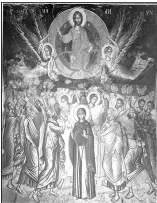
Icoana „Înălțării Domnului” din biserica Stavronichita, Muntele Athos

Indată ce vei săvârși păcatul, se depărtează Domnul de sufletul tău și intră diavolul de îl pângărește și îl face atâta de murdar și urât, încât de ar fi cu putință să-l vezi, o păcătosule, te-ai înfricoșa și te-ai cutremura singur” (Mântuirea păcătoșilor, pag. 33)